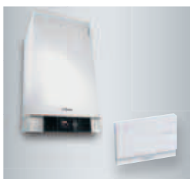
Vitodens 300-W + Vitocom 100 typ LAN1

Ku každej balíkovej zostave Vitodens 300-W (vi . kompaktný cenník, str. 12) (platí tiež pri objednávke samotného kotla s príslušenstvom: zásobníkový ohrievač, montážna pomôcka, prepájacia sada kotol-zásobník, diaľkové ovládanie) resp. ku každému kompaktnému kotlu Vitodens 333-F / 343-F (vi . kompaktný cenník str. 13) bude zadarmo dodaný 1 ks Vitocom 100 typ LAN1 (obj. . Z011389), 1 ks spojovací kábel LON (dĺžka 7 m, obj. . 7143495) a 1 ks koncový odpor LON (obj. . 7143497).