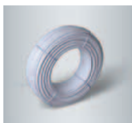
5-vrstvová plastliniková rúra ViPERT